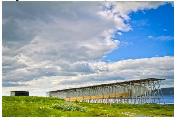
Figura 1: O Memorial Steilneset, visto desde a costa.

Sobre Vardø, uma ilhota ao extremo Nordeste do país, inserida no Círculo Polar Ártico, Turner (2012) descreve como um lugar de ventos fortes, sem árvores e repleto de casas de madeira, onde os únicos destaques são a torre da Igreja Eyvind Moestue de Vardø (1958) e o Memorial Steilneset.