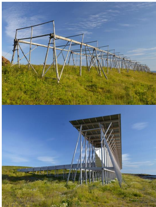
Figura 4: Estrutura vernacular para secar bacalhau e, abaixo, o Memorial Steilneset.

Além da já mencionada representação do costume local relacionado às lâmpadas, identifica-se, ainda, na estrutura de madeira que sustenta o edifício linear, uma releitura da forma do cavalete usado pelos pescadores nativos para secar o bacalhau (Figura 4).