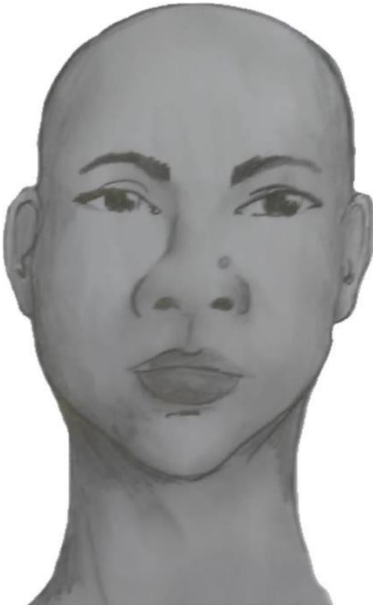
a) Perfil Frontal