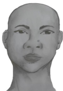
iv. Perfil Esquerdo