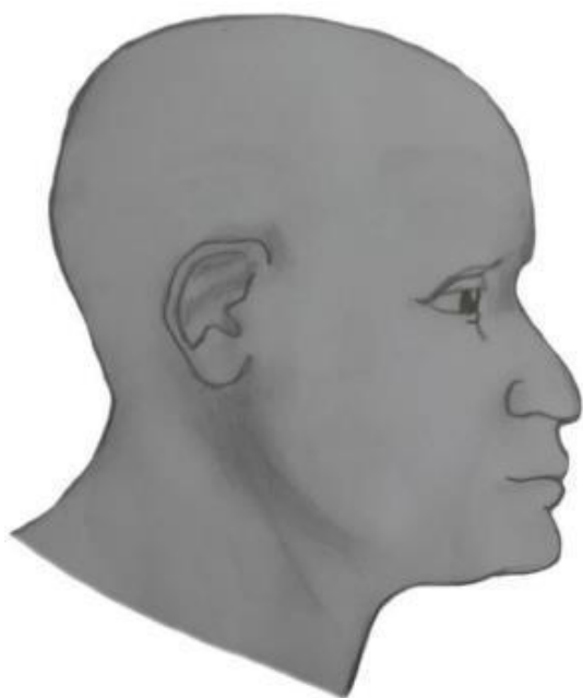
c) Perfil Esquero